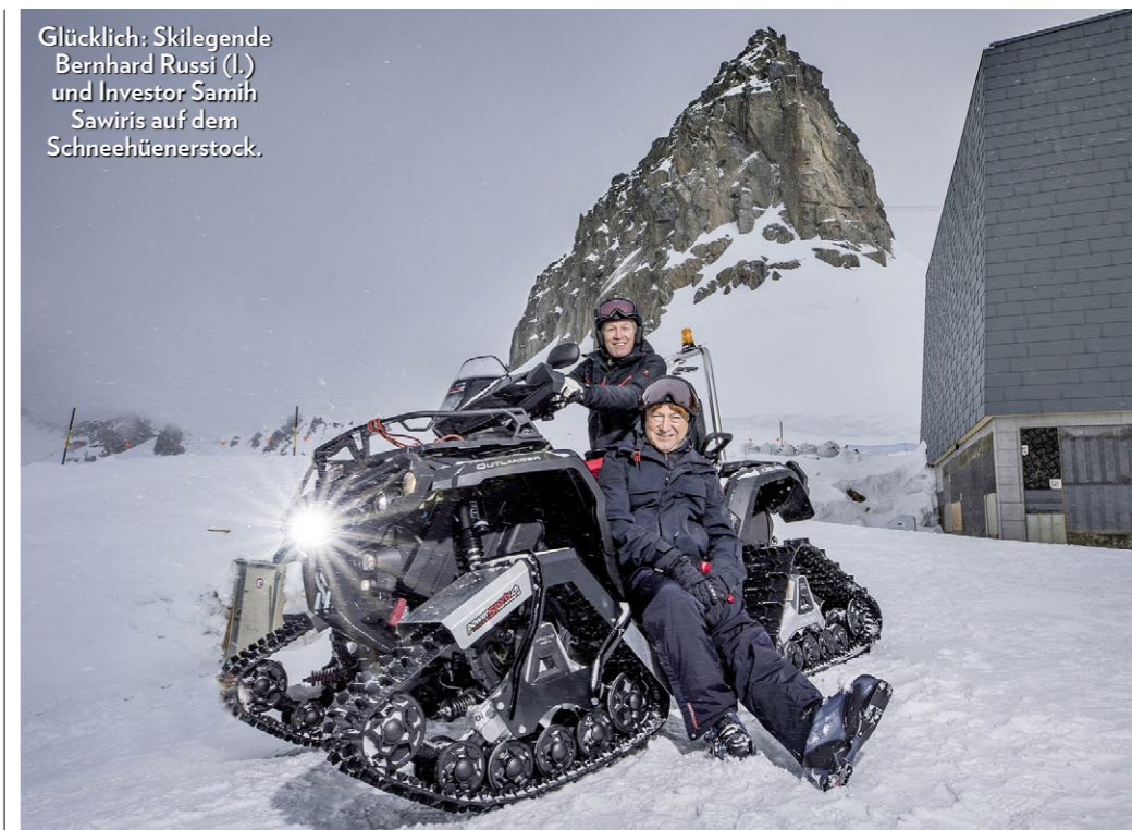
Glücklich: Skilegende Bernhard Russi (l.) und Investor Samih Sawiris auf dem Schneehüenerstock.